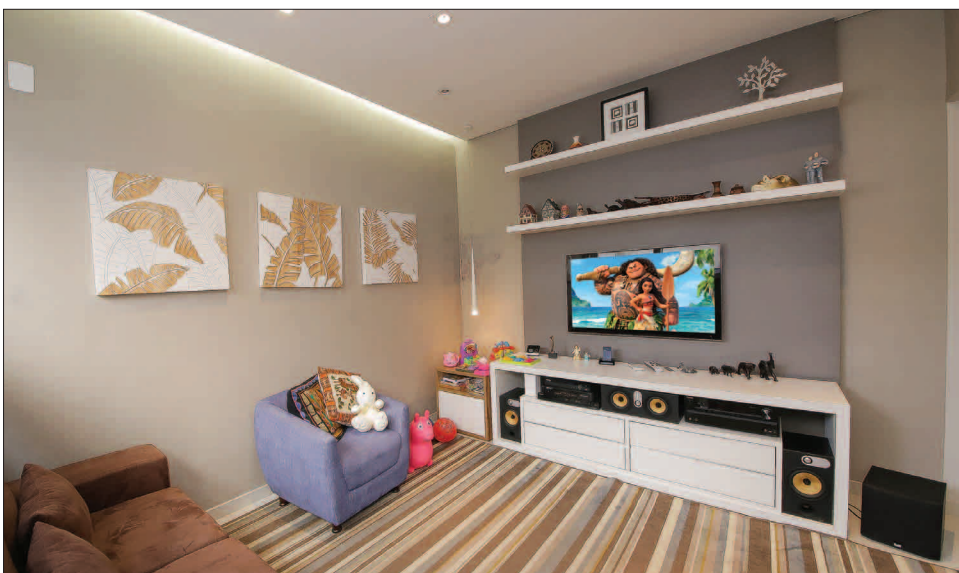
Da reinstalação dos equipamentos do antigo apartamento nasceu o segundo home theater, localizado na sala de TV. Este sistema 5.1 canais com TV de 50" divide espaço com a brinquedoteca.